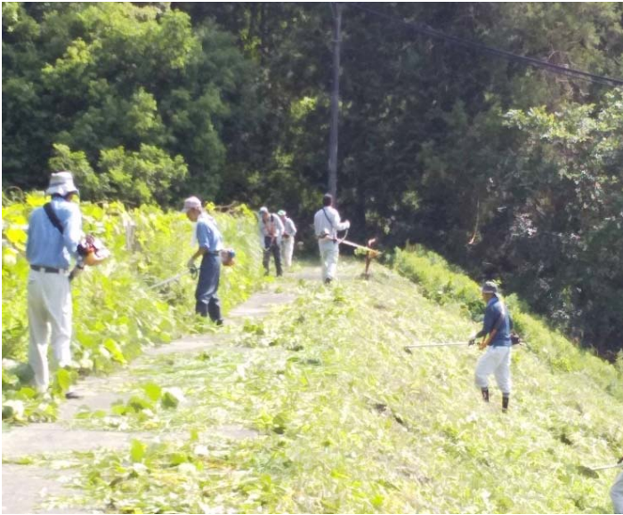
大ヶ谷池の草刈りの様子