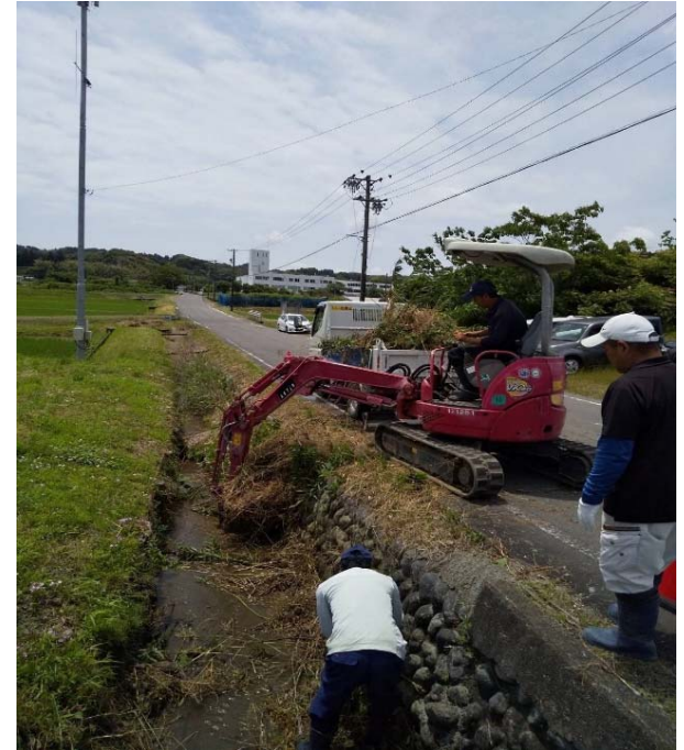
用水路土砂撤去の様子