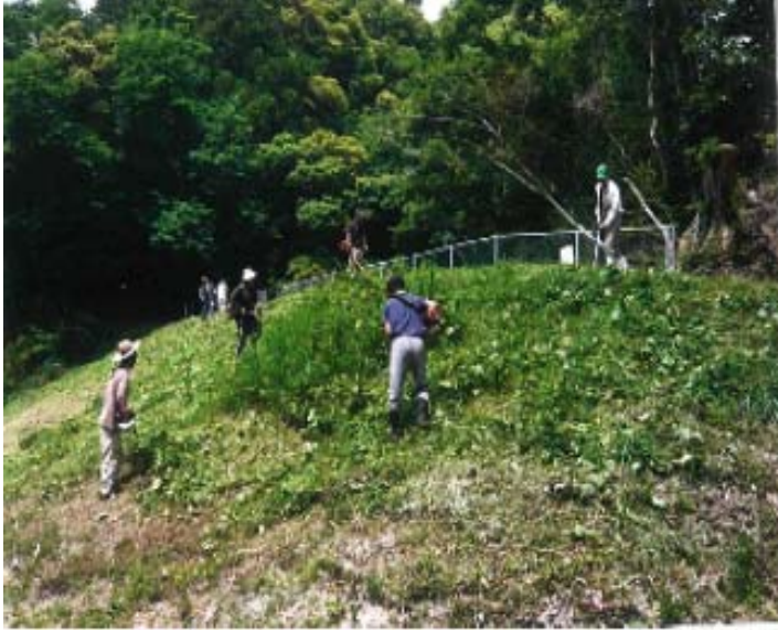
農業用ため池堤体の草刈り