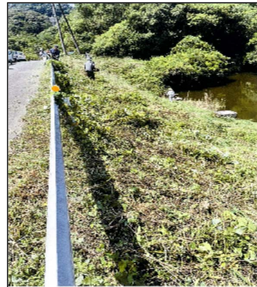
農業用ため池の草刈り作業