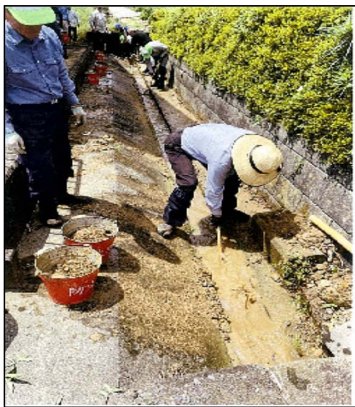
水路の泥上げ作業