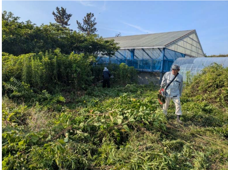
水路の砂上げ時の草刈りの様子