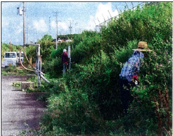
ファームポンド法面の草刈作業