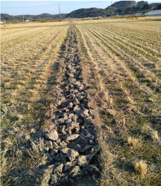
小区画の田んぼを集約している様子