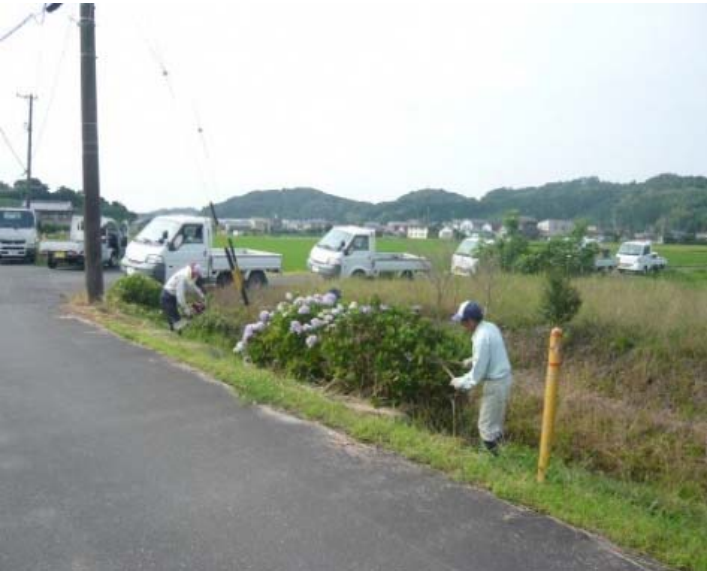
水路法面に植えたアジサイの刈込