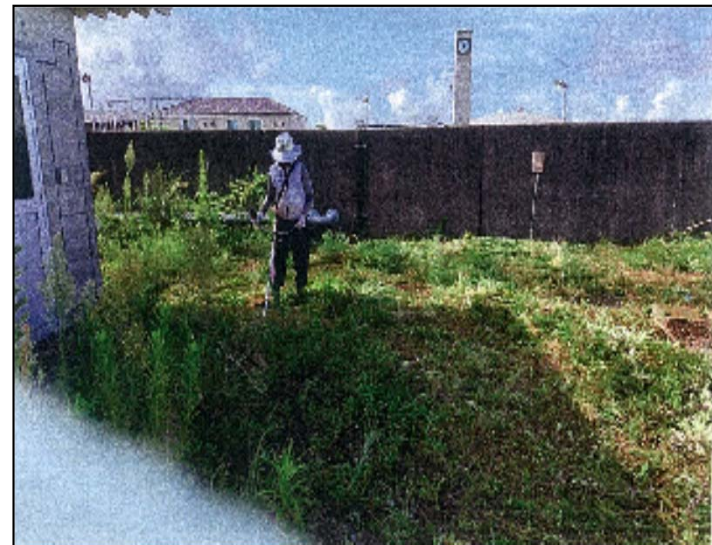
ファームポンド施設周りの草刈作業