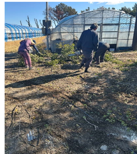
伐採した木の回収風景