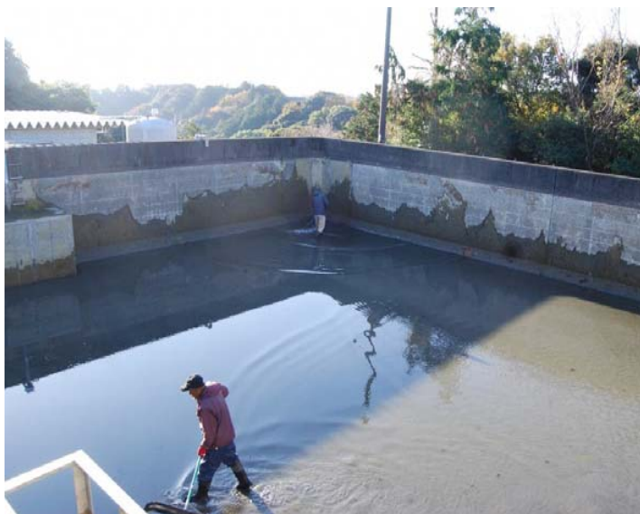
ファームポンド内清掃活動