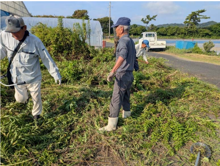
水路の砂上げ時の草刈りの様子