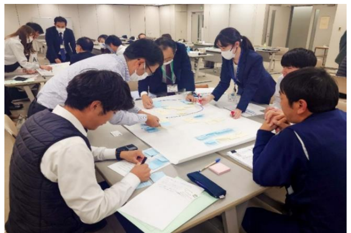
ブレインストーミングに取り組む参加者